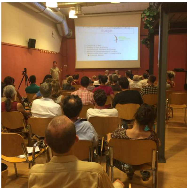
. 5 Les membres du Léman dans la salle Carson (2)