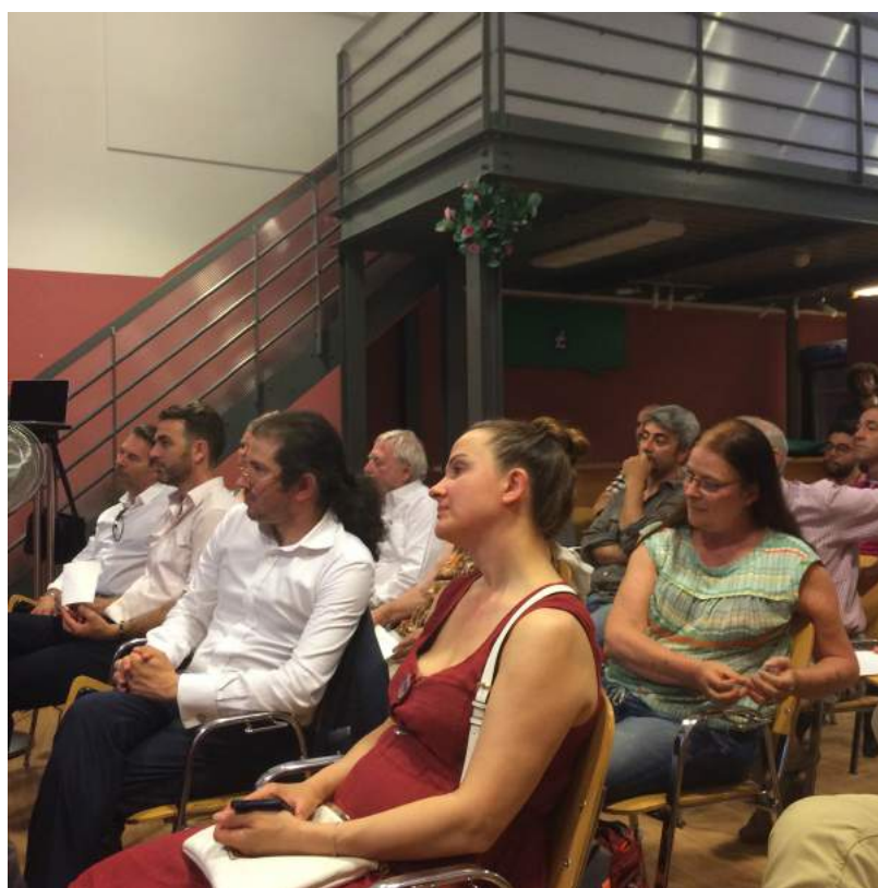
. 4 Les membres du Léman dans la salle Carson (1)