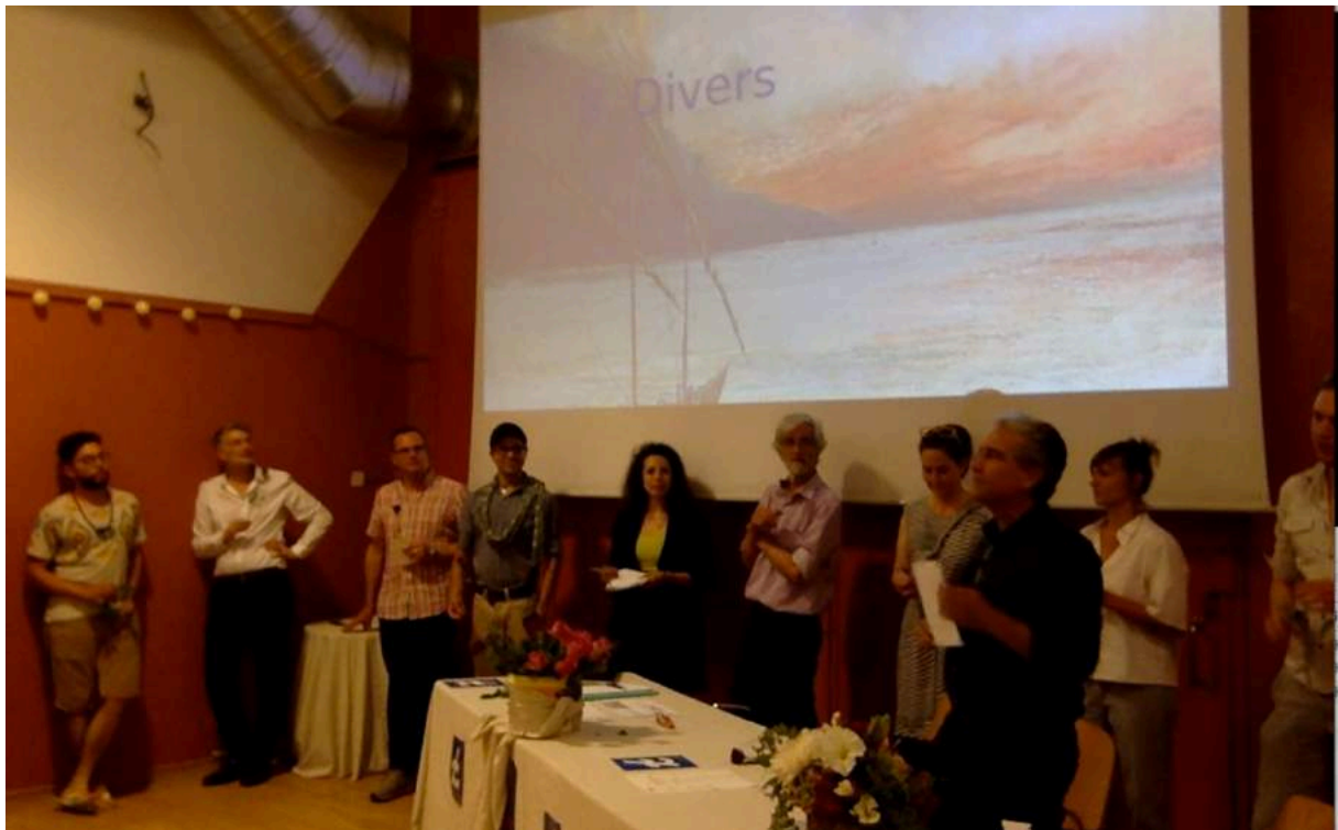
. 15 Le nouveau comité conjoint de Monnaie Léman