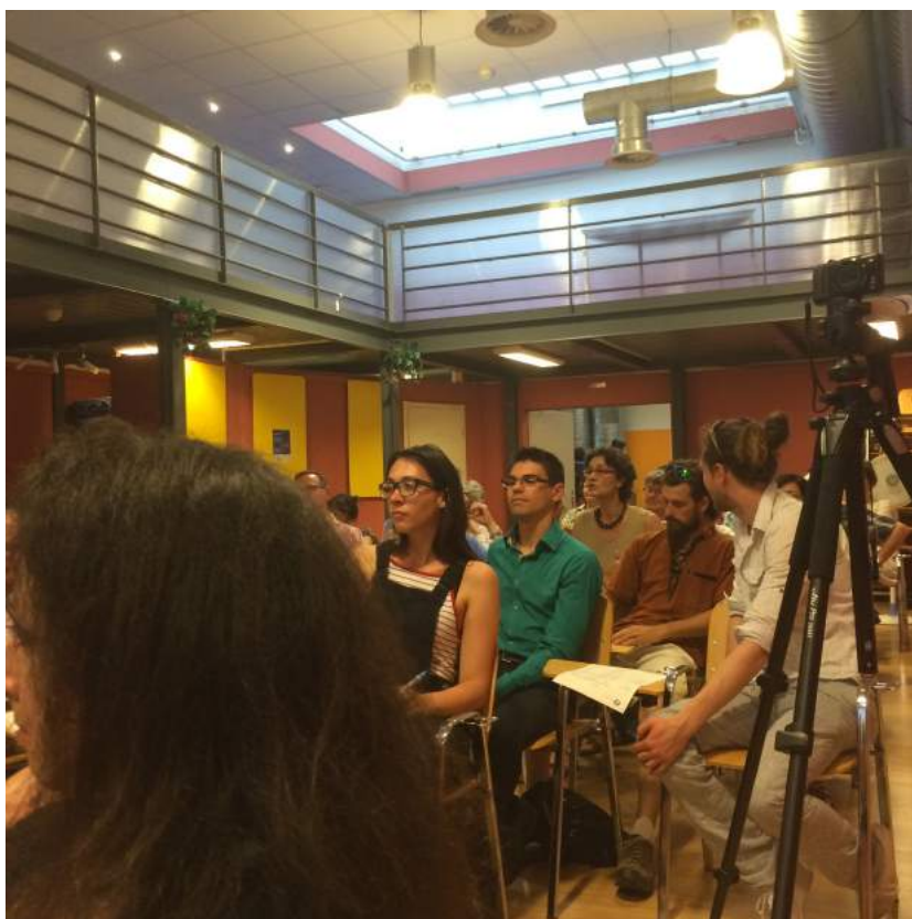
. 6 Les membres du Léman dans la salle Carson (3)