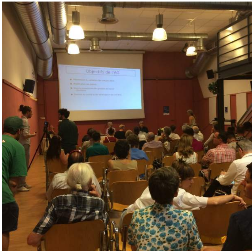
. 1 Une centaine de membres sont présents à la 1 ère AG statutaire conjointe de Monnaie Léman (Suisse et France)