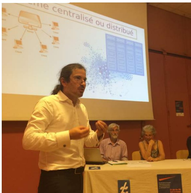
. 14 Système centralisé ou distribué : quelle gouvernance pour le e-Léman ?